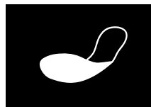
PLANTILLA ANTI- PERFORACIÓN FLEXIBLE