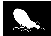
PLANTILLAS EXTRAÍBLES LAVABLES